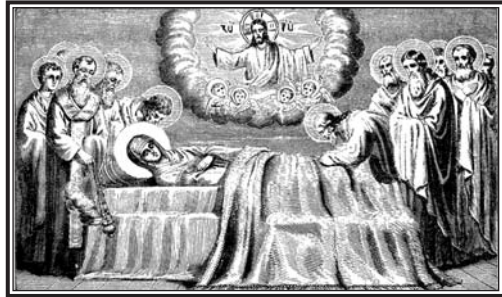
(բարեփոխված չորրորդ հրատարակություն)