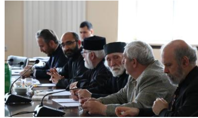
Հանդիպում հոգևորական դասախոսների հետ

Նույն օրը՝ թանգարանում շրջելուց հետո ճեմարանականներն այցելեցին Մոսկվա կինոթատրոն՝ դիտելու Terry George-ի հեղինակած Հայոց Ցեղասպանության մասին պատմող «The promise» (Խոստումը) ֆիլմը: